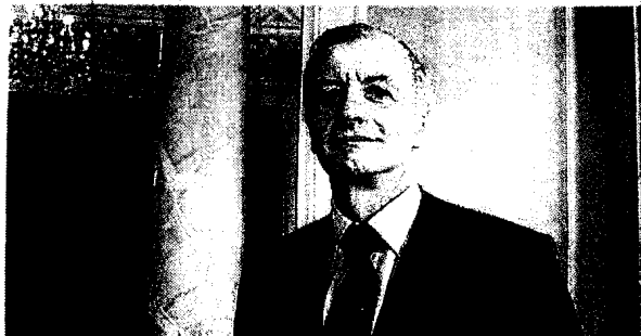
Mario Rizzante Reply