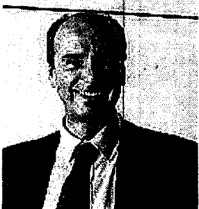
Francesco Sinigaglia Bioxell